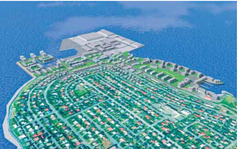
VESTURBÆRINN Íbúafjöldi á Kársnesi mun tvöfalda og atvinnusvæði þrefalda ef áætlanir bæjaryfirvalda ná fram að ganga, að sögn Betri byggðar á Kársnesi.

Íbúar á Kársnesi í Kópavogi hafa stofnað samtökin Betri byggð á Kársnesi til að sporna við hugmyndum um nýtt skipulag á svæðinu. Vesturbær þessa næststærsta sveitarfélags landsins mun umbreytast töluvert við nýtt skipulag, en mikil undiralda er meðal íbúanna, sem hafa aðra sýn á framtíð Kársness en bæjaryfirvöld.